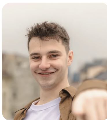
Titas Medelis Jaunimo informavimas ir konsultavimas